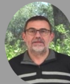
Maire d'Enquin lez Guinegatte